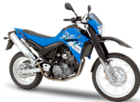
XT660R – Racing Blue (DPBSE)