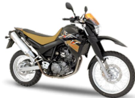
XT660R – Yamaha Black (YB)